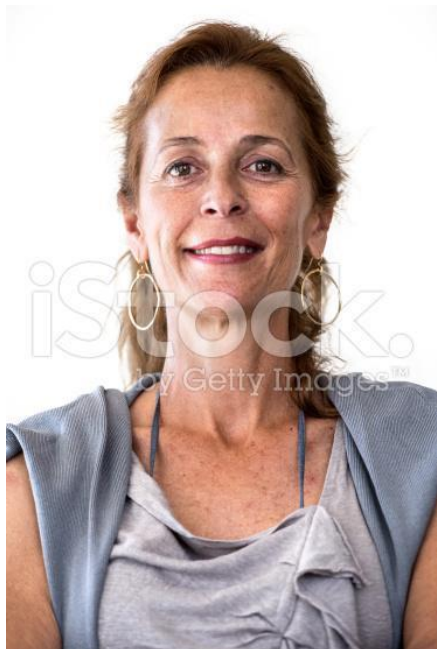
Lone, 46 år Løjre Kommune Dansk- og musiklærer